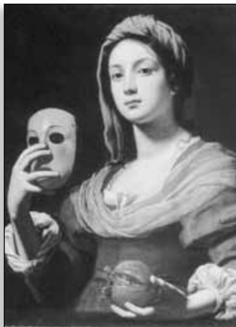
L. Lippi - Allegorie de la simulation

ca Nazionale de Sienne...) et françaises (les musées des Beaux-Arts d'Angers et de Bordeaux, l'Abbaye royale de Chaâlès et le musée du Louvre), ainsi que du Kunsthistorisches Museum à Vienne. Mais elle doit beaucoup aussi au concours généreux de collectionneurs privés, avec des prêts qui en font un événement unique en Corse.