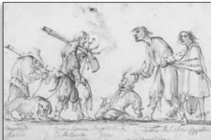
Baccio del Bianco - Baccio qui rentre de la guerre