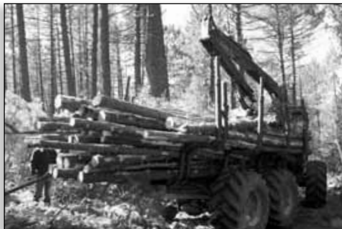
Travaux sylvicoles dans une formation de pins, à Quenza

plus de 20 pays. Dans l'espace méditerranéen, la seule forêt modèle totalement développée se situe en Espagne, à la Comarca de Pinares de Burgos y Soria qui se trouve au pied des Picos de Urbion.