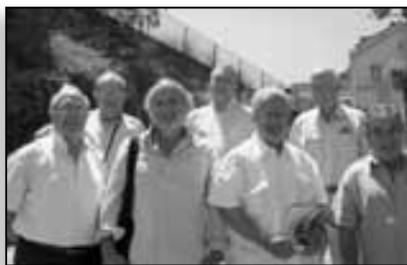
Les administrateurs du CRPF, propriétaires élus

Tous trois nous paraissent incontournables. La gestion durable des forêts est fondamentale pour garantir un patrimoine de valeur (au sens économique et sur le plan de la biodiversité) aux générations futures. Cette gestion durable est encouragée par le code forestier. Les documents de gestion durable (tels que le Code des Bonnes Pratiques Sylvicoles ou le Plan Simple de Gestion) sont nécessaires à l'obtention de financements pour la mise en valeur de la forêt et la certification PEFC [voir page suivante]. Pour ce qui est du second thème choisi, il est d'autant plus incontournable que le Chêne vert est l'essence la plus présente en Corse, puisqu'elle représente 40% des forêts