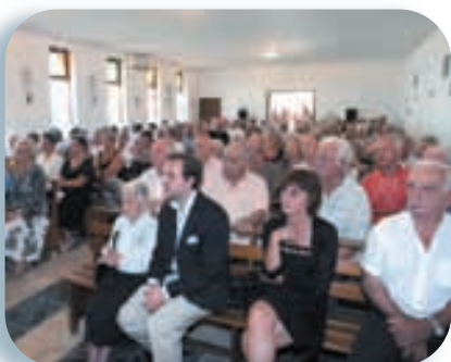
L'assistance nombreuse en l'église Notre Dame des Flots