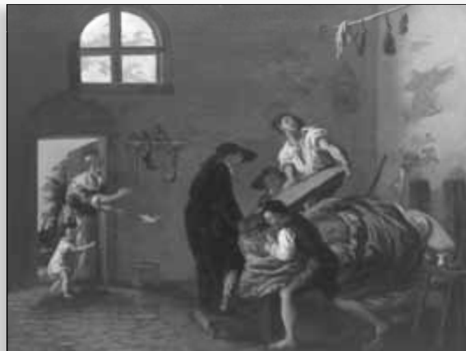
Volterrano - La farce du cureé Arlotto

Bilivert , en passant par Lorenzo Lippi , et Carlo Dolci (pour ne citer qu'eux), l'exposition embrasse les différentes tendances picturales (parfois profondément divergentes entre elles) du Seicento fiorentino . L'exposition s'articule autour des plus grands chefs d'œuvre de la littérature italienne : la Divine Comédie de Dante et le Décameron de Boccace ; le Roland furieux de Arioste et la Jérusalem délivrée de Tasse . Dans l'une des salles, on peut admirer un cas emblématique de « collectionnisme » de Florence au XVII e siècle (où des sujets inspirés des poèmes de Arioste et de Tasse côtoient, comme à l'époque, d'autres sujets tirés des Métamorphoses d'Ovide et de l'Ancien Testament ). L'exposition se poursuit par un ensemble de figures allégoriques des Arts (la Peinture, la Sculpture, l'Architecture, la Poésie, la Musique, la Comédie...). Cette exposition exceptionnelle est rendue possible grâce aux prêts généreux de nombreuses institutions toscanes ( Galleria degli Uffizi , Galleria Palatina , villa medicea della Petraia –, l'Opificio delle Pietre Dure , l'Istituto di Studi Etruschi , et la Pinacote-