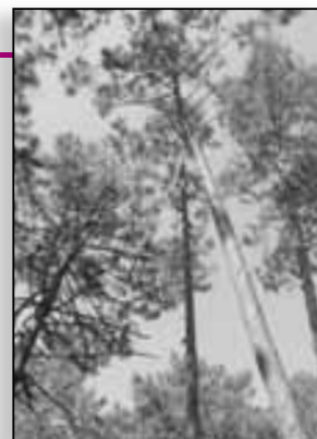
La forêt de Pinia

Exemple de mobilisation des fonds publics dédiés aux équipements et aménagements pour l'accueil du public en forêt : l'ONF s'est engagé à hauteur de 400000 € pour A Piscia di Ghjaddu, de 70000 € pour la création d'un sentier thématique en forêt communale de Murzo et de 150000 € pour la création d'une aire de stationnement lieu dit Mezzanu commune de Piana. En 2009, il a accueilli en forêt près de 1220 enfants dans le cadre de visites guidées. De son côté, le PNRC a réalisé en 2009 220 sorties avec des scolaires pour 3118 élèves, et 13 sorties grands publics pour 356 personnes.