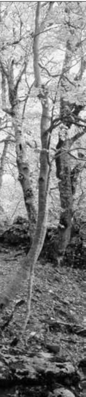
La forêt de San Pedrone

est plus facile à détruire qu'à recréer. Les propriétaires disposant d'un nouvel outil simple de diagnostic, l'Indice de Biodiversité Potentielle (IBP) [voir encadré ci-contre], nous tenions à les sensibiliser à cet outil.